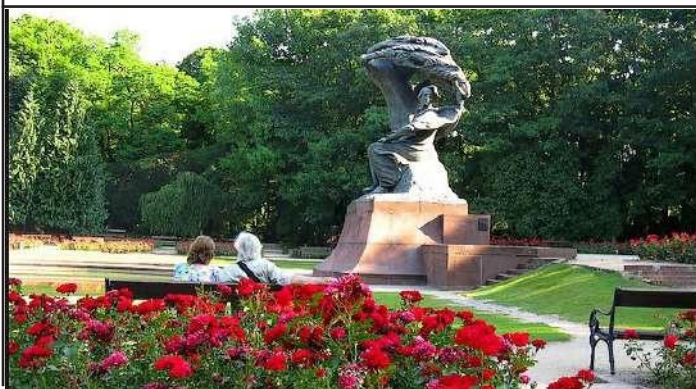
Pomnik Fryderyka Chopina