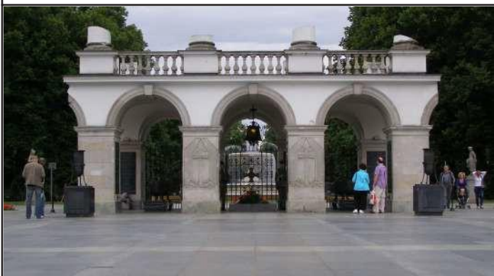
Grób Nieznanego Żołnierza