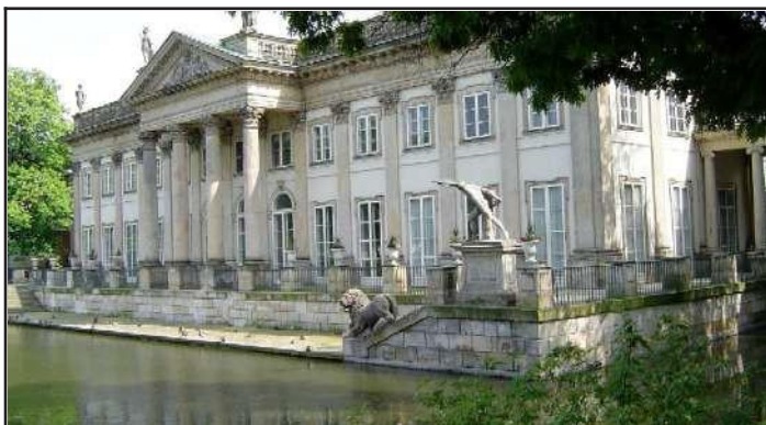
Łazienki Królewskie (Pałac na Wodzie)