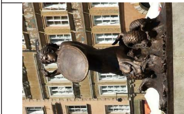
Pomnik Warszawskiej Syrenki