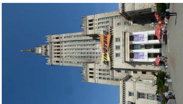
Pałac Kultury i Nauki