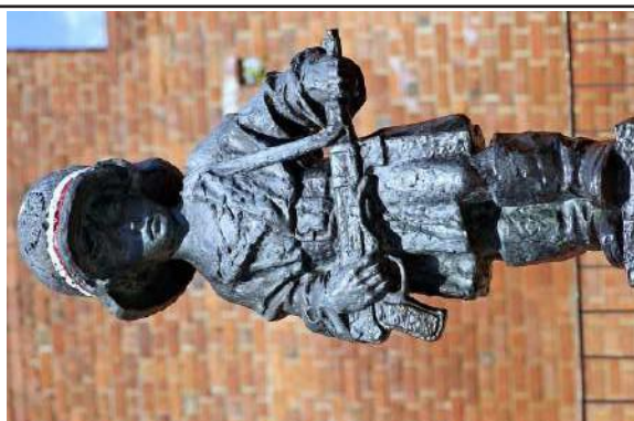
Pomnik Małego Powstańca